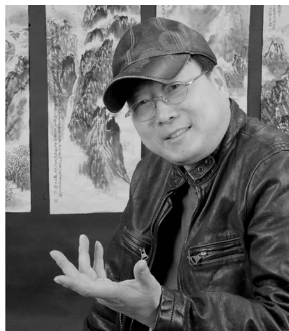
旅美著名畫家穆家善教授近影

西方文化多是偏向於科學，我們的文化多為偏向人性。中國畫畫一根綫條，一點墨色，這是現實生活中沒有的，西方人是用真實的眼光看世界，表現出抽象的畫面，因為西方的世界在人們眼裏本身就是光怪陸離的。而中國人是用浪漫的眼睛看世界，表現的是一個具象的世界。