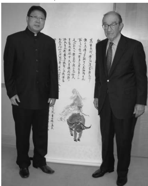
格林斯潘博士與著名畫家穆家善合影與華盛頓

形，不拘程式，放達肆恣，但得意不忘形，形似意存。他遠追宋元，近學傅抱石、李可染、陸儼少諸家，以自然山水為師，有着意于文人情趣和逸格。逸筆之難，難在功力，難在境界。穆家善的畫作力求筆墨功力的表現，而其心境則已趨淡靜深遠。因之，其畫有逸氣，他寫山寫樹，狀其形、取其勢，常嘆山川之廣袤深厚，而紙筆有限，如何在咫尺之中圖山川萬象，尤其是表現其混