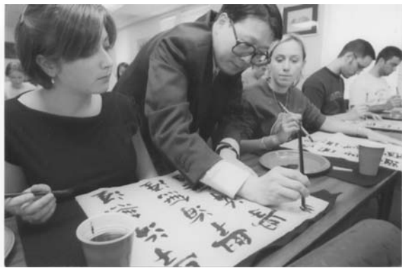
2002年穆家善教授應邀教授哈佛大學、耶魯大學研究東亞文化的博士生學習中國書法

穆家善有着豐富的人生閱歷，他當過兵，也做過工人，又幸運地在新文人畫的重鎮南京藝術學院進行專業深造。其性秉直、其情真摯，以致於在他研究生畢業不久，就已經成為新文人畫的幹將之一而嶄露頭角。他以中國筆墨抒寫心中之語，以致佳作不斷，碩果累累。