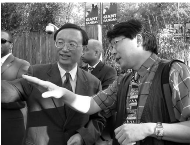
外交部長楊潔篪與穆家善交談

我的畫室叫“墨雨樓”，我的號叫青口山人，這是80年代我的老師陳大羽給我起的名字。我的書房的名字有點俗，但是我覺得很好，就叫“靜心齋”，我就直截了當告訴自己，不需要裝弄儒雅，就是要安靜下來。當我走進書房拿起筆