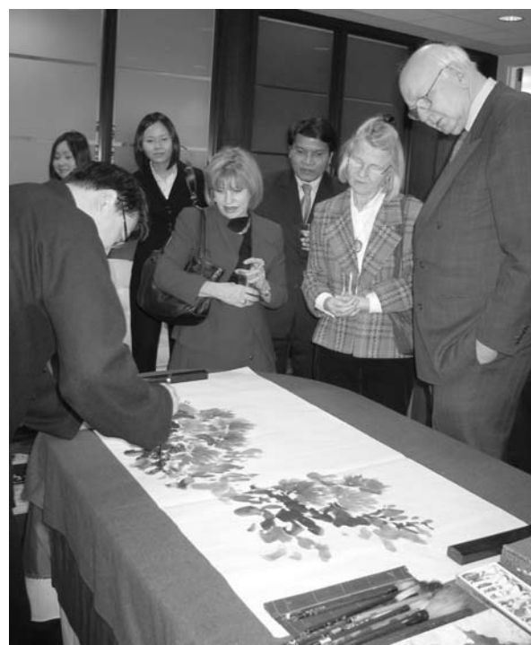
穆家善應邀為美聯儲前主席(格林斯潘前任)保羅·沃爾克80大壽作畫，保羅·沃爾克夫婦和美國國家銀行紐約副行長米西爾·格爾菲(中)觀看穆家善當場作畫并收藏

三是墨與色交匯，擅用潑色破墨，其法可以看到劉海粟、李可染的影響，但又有自己的新創新用，不為成法所拘。中國畫用色，看似容易實則難，處理不好，就會亂而無序，不僅無形亦會無韻。穆家善畫作如2007年的《大峽谷之春、